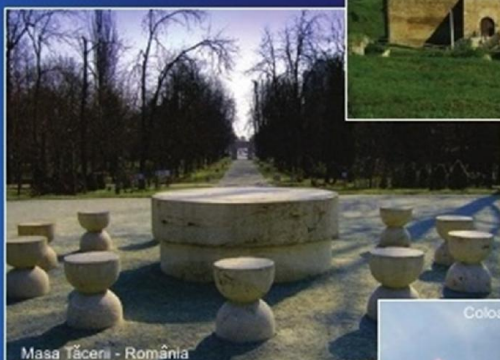
Masa Tăcerii - România