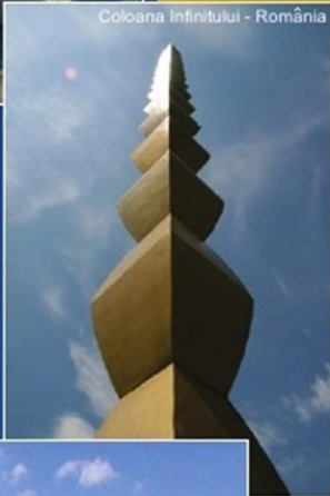
Coloana Infinitului - România