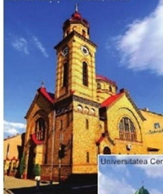
Biserica Vârșeț - Voivodina, Serbia